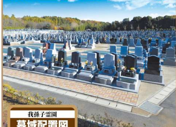
我孫子霊園 墓域配置図